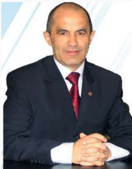
Фаттахов Энгель Навапович (министр образования и науки Республики Татарстан)

Инклюзивное образование в эпоху информационного общества — это, действительно, реальный путь в будущее, где смогут учиться все, всегда, всю жизнь, для себя и для общества, создавать на основе знаний новое качество жизни людей планеты.